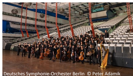
Deutsches Symphonie-Orchester Berlin